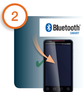
Bluetooth in den Einstellungen des Smartphones aktivieren Activate Bluetooth in the smartphone settings