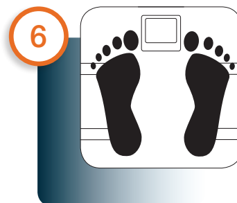
Nach Aufforderung der App die Benutzerzuordnung durchführen Assign the user when requested to do so by the app