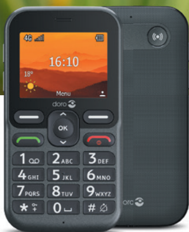
DORO LEVA L11