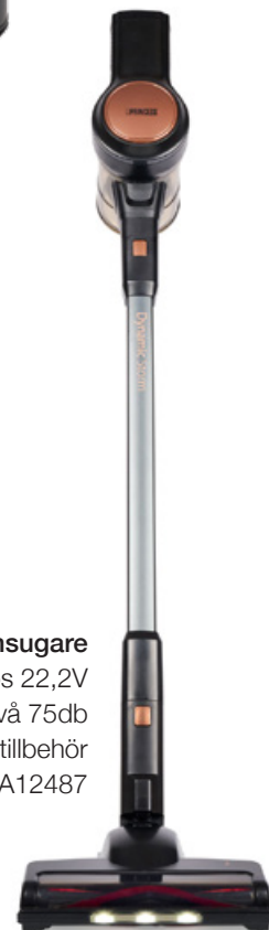
Skaftdammsugare sladdlös 22,2V låg ljudnivå 75db inkl. tillbehör Art. nr: A12487