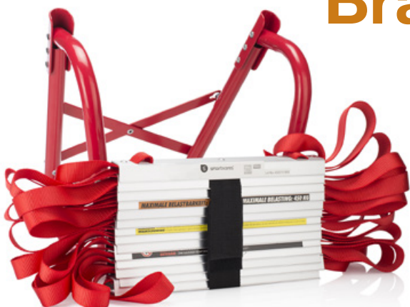
Brandstege 4,5m eller 10m Art. nr: 10.015.18 • Art nr:A10737