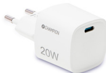
Laddare 20W PD Vit