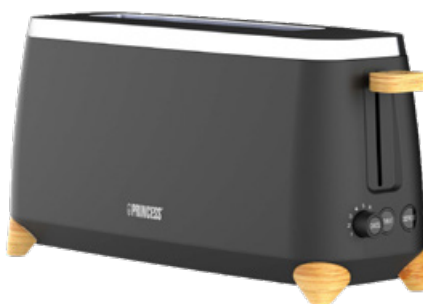
Brödrost Luxurious Bamboo Art. nr: 142361