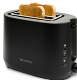
Brödrost Art. nr: CHBR300