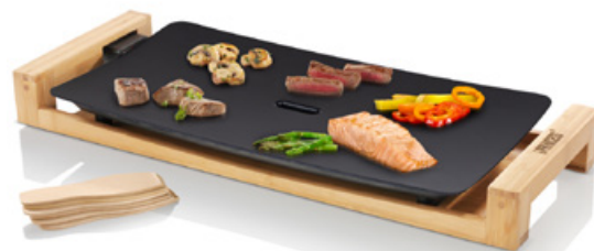
Bordsgrill Bamboo 50X25, Art. nr: 103026