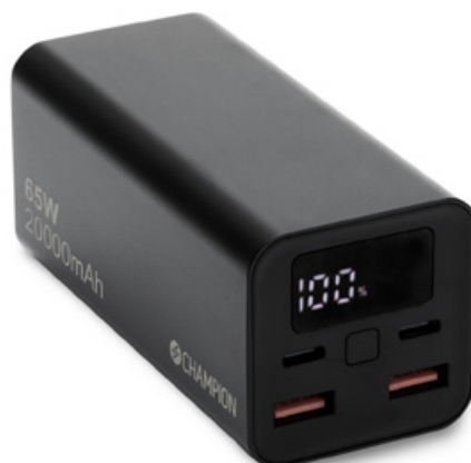
PowerBank 20000 mAh 65W PD

Champions nya powerbank med imponerande 65W ger snabb och effektiv laddning för din bärbara dator, surfplatta eller smartphone. Med två USB-C och två USB-A-portar erbjuder detta kraftpaket flexibilitet för att ladda flera enheter samtidigt. Självklart stödjer den både Power Delivery (PD) och Quick Charge (QC).