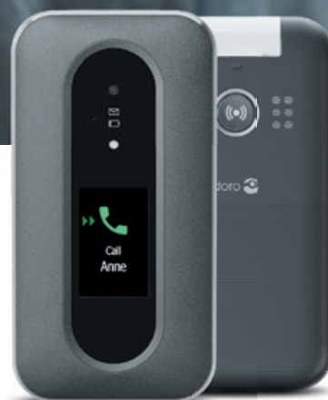
DORO LEVA L31

Nya Leva-serien erbjuder enkla, trygga 4G-telefoner för alla åldrar och förmågor.