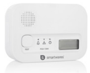
Kolmonoxidlarm 10 års-sensor Art. nr: FGA-13041