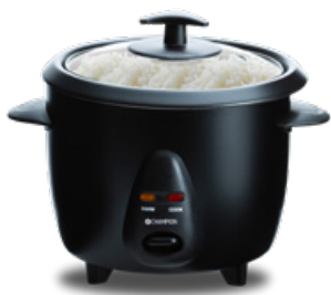
Riskokare Mini Art. nr: CHRK400