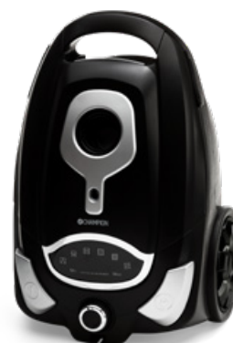
Dammsugare Eco Clean Art. nr: CHDS400