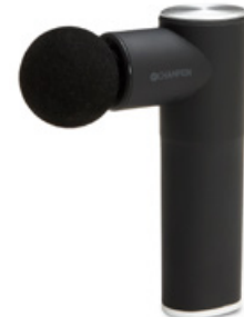
Massagepistol Art. nr: CHMG400

”Visst blir livet lite enklare när du hittat din grej? Champions hemelektronik finns alltid med dig. I köket när du lagar mat, på väg till jobbet, på resan och hela vägen hem igen till fredagsmyset i soffan.”