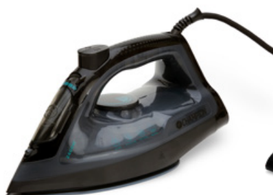
Strykjärn keramisk Art. nr: CHSJ500