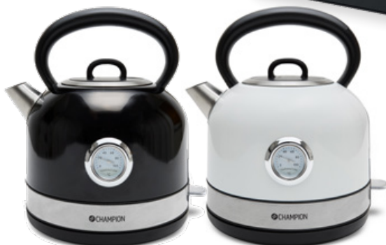
Vattenkokare Retro Art. nr: CHVK401 & CHVK402