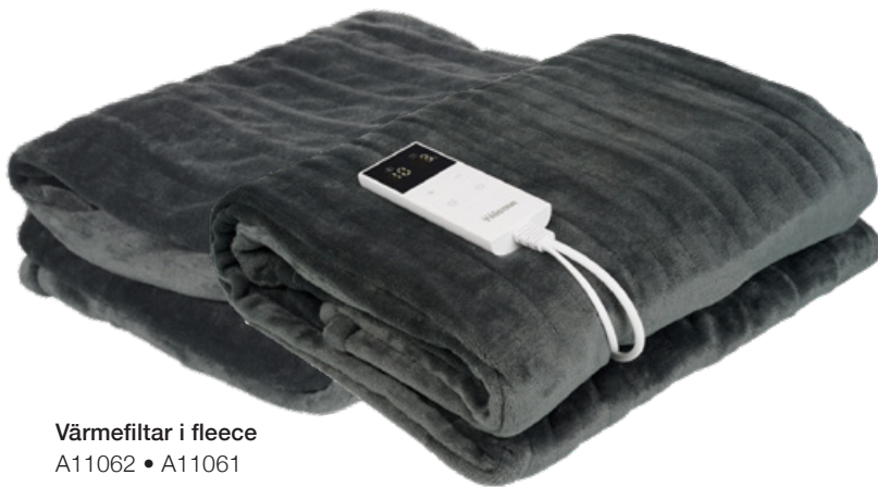
Värmefiltar i fleece A11062 • A11061