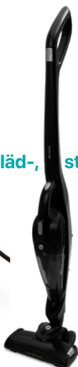
Skaftdammsugare Eco Clean Art. nr: CHSD420