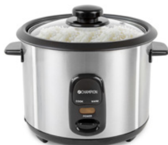
Riskokare Art. nr: CHRK500