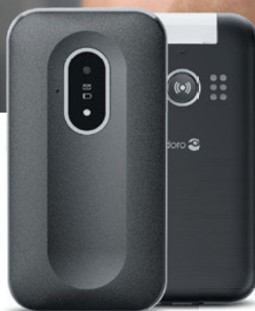
DORO LEVA L21