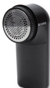
Noppbortagare Art. nr: CHLR300