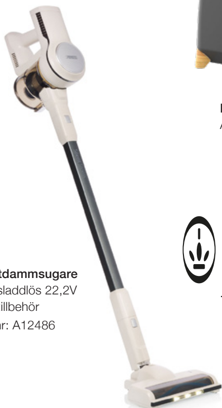
Skaftdammsugare Tyst sladdlös 22,2V inkl. tillbehör Art. nr: A12486