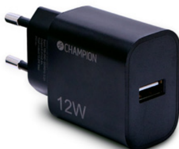
Laddare 12W Svart