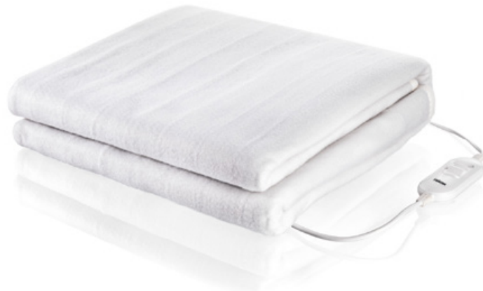
Bäddvärmare Olika storlekar Art. nr: BW-4752 • Art. nr: BW-4751