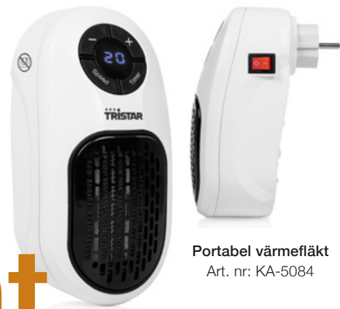
Portabel värmefläkt Art. nr: KA-5084