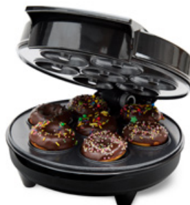
Donut Maker Art. nr: CHDM400