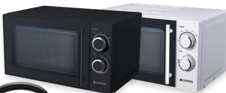
Mikrovågsugn Art. nr: CHMW211 & CHMW212