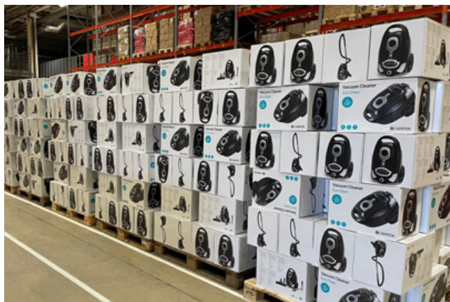
Det är en fantastisk känsla när produkterna äntligen nått vårt lager i Helsingborg, säger Isabell.

– Då vi arbetar i en bransch som handlar mycket om förbrukning, blir det ännu viktigare att ta fram produkter som är miljövänliga och hållbara. Ett exempel på vårt hållbarhetsarbete är att vi har tagit fram produkter med PFAS-fri beläggning. Ett annat exempel är vårt arbete med att kartlägga och lagerföra våra reservdelar för att få en tydlig överblick av vilka delar vi har. Detta för att minska vår "slit- och släng-konsumtion".