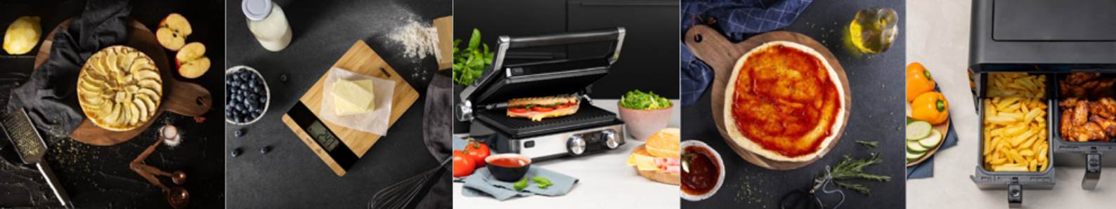
Köksvåg Bamboo Art. nr: 492944