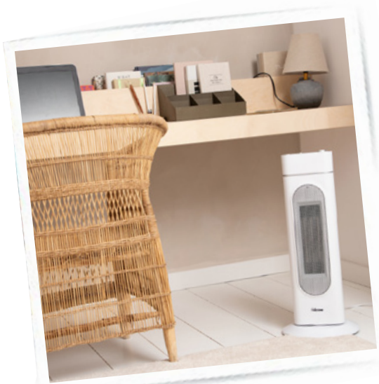
Värmefläkt 2000W Keramiskt element Art. nr: KA-5088