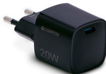
Laddare 20W PD Svart