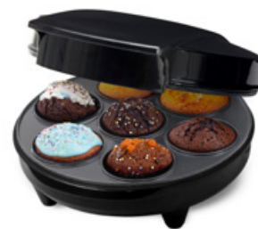
Muffin Maker Art. nr: CHMM400