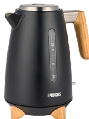
Vattenkokare Bamboo Luxurious Art. nr: A11445