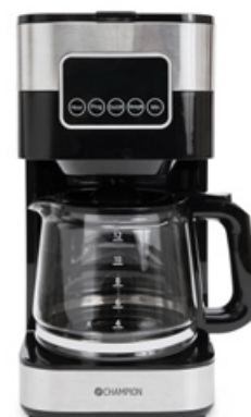
Kaffebryggare Art. nr: CHKB400