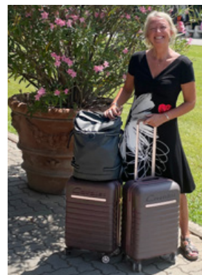
Cavalet Pasadena Kabin och Delsey Paris Raspail ryggsäck

jag för att bäst för att hantera packningen på flyg, vandring och tåg, bland trängsel och i sommarvärme? Jag köpte två kabinväskor från Cavalet och därtill en ryggsäck att fästa fast på handtaget. Det blev så bra! Säkra lås, mycket utrymme och fack samt lättkörda hjul som klarade av lång vandring på steniga vägar och halvrisiga trottoarer. En mycket bra investering som jag varmt rekommenderar för ett bekymmersfritt resande.