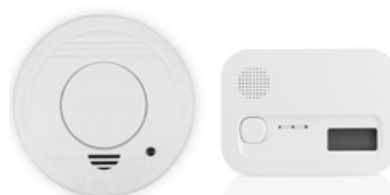
Brandsäkerhetskit Brandvarnare+Kolmonoxidlarm Art. nr: FSE-19204