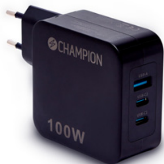
Laddare 100W PD / QC Svart